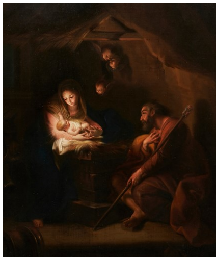
SACRA FAMIGLIA Pompeo Batoni

Please be sure to take home a special Bulletin after our Christmas Eve and Christmas Day Masses. In it, you will find descriptions of the ministries and organizations that are active in our parish, and ways that you might share in the work that they do.